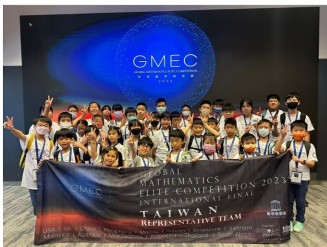
※2023 年 台灣代表隊