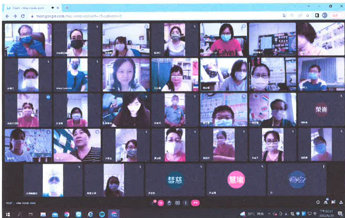
說明：線上會議情形

地點：線上會議 https://meet.google.com/mks-vzmb-ebm