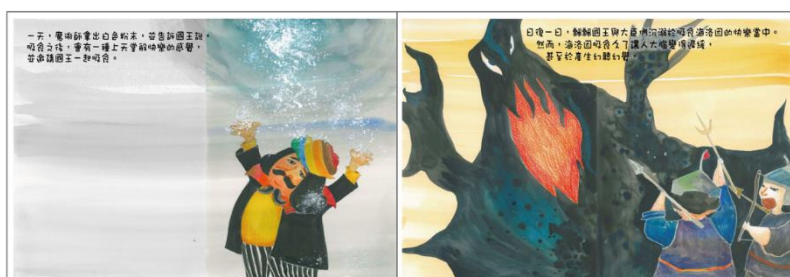
※範例作品：教育部反毒繪本—山茶花婆婆/洪孟真、呂舒婷